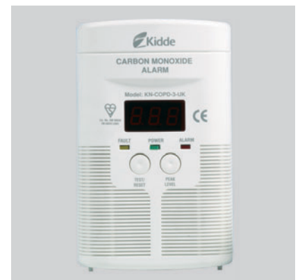
Detektor ugljen-monoksida AC digitalni 900-0211UK