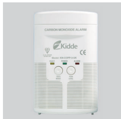
Detektor ugljen-monoksida AC 900-0191UK

Lako ih je ugraditi na zidove ili plafone blizu moguće opasnosti - gasni bojler, peć, dimnjak... Ne zaboravite, samo uz KIDDE alarm za dim i ugljen monoksid eliminisali ste veoma ozbiljnu opasnost i obezbedili da svoj život i poslovanje bezbrižno i dugoročno planirate.