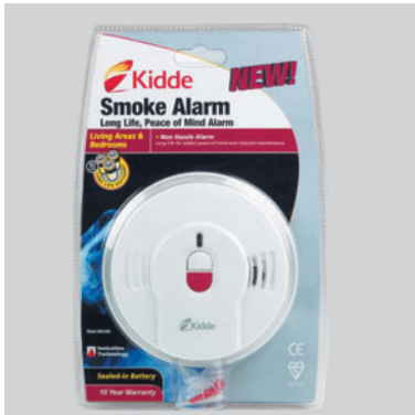
Detektor dima sa vekom trajanja 10 godina 0910 UK

Trovanje ili gušenje dimom je takođe najčešći uzrok stradanja ljudi u požarima jer zbog smanjene vidljivosti i dezorijentacije žrtve nisu u mogućnosti pronaći izlaz iz opasnosti za sebe i za osobe koje pokušavaju da spase. KIDDE aparati za detekciju dima i ugljen monoksida spašavaju živote dece, odraslih, naših porodica, prijatelja i kolega jer svako ima pravo živeti u sigurnom okruženju!