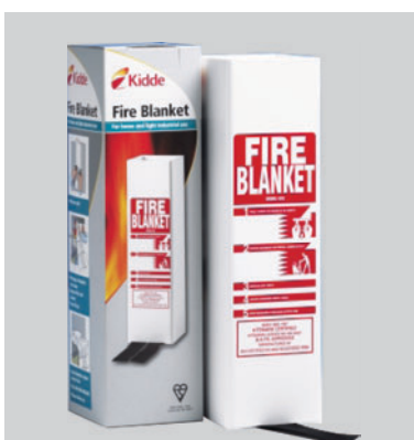
Protivpožarno čebe K75