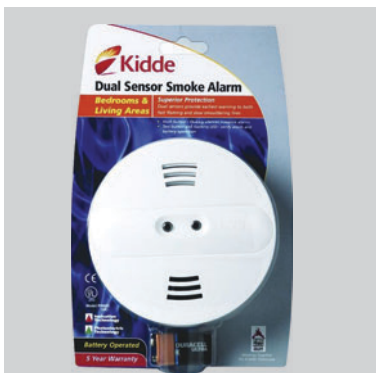
Detektor dima sa dvostrukim foto i jonskim senzorom PI900UK