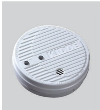
Detektor dima za naseljene prostore sa prigušivačem 0916 UK